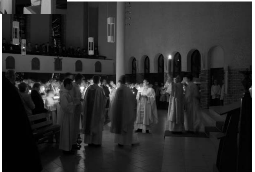
Litania do Wszystkich Świętych, odśpiewana przez mężczyzn przy chrzcielnicy.