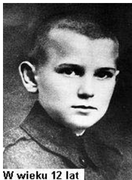
W wieku 12 lat

1926 - początek nauki szkolnej. W latach dziecięcych rozpoczyna się służba ołtarza, wycieczki w góry 1929 - umiera matka, a w 1932 r. brat Edmund, co jest dużym ciosem emocjonalnym dla młodego Karola