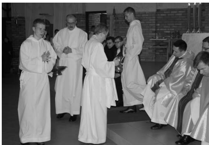
Liturgia Wielkiego Czwartku - umycie nóg 12 mężczyznom