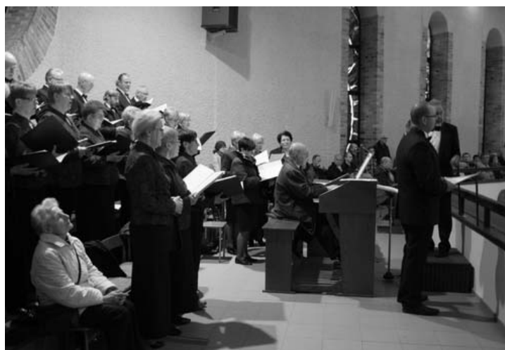
Jak zawsze w czasie świąt śpiewał chór Familia Cantans