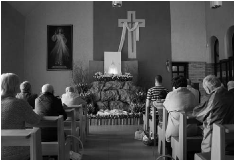
Wielka Sobota - czas trwania w ciszy przed Grobem Pańskim...a także czas tradycyjnego święcenia pokarmów na wielkanocny stół.